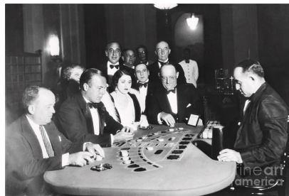
Mynd 2: Myndin sýnir fjárhættuspilara í spilavíti í Havana. Heimild.

(Ríkissjóður) Þau ræna á þingi ríkissjóð, reisa fjallið bratta. Undan grafa Íslandsþjóð, aftur hækka skatta.